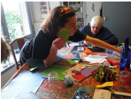
2011 - Origami