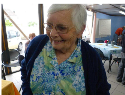
2013 - Anniversaire RERS Créon