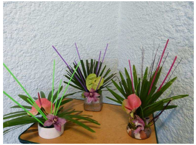
Février 2021 – Anthurium – Orchidée – palmier Chamærops découpé.