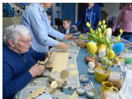
2013 - Déco œufs