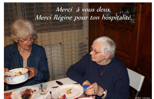
2013 - un 23 mars