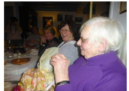
2018 - Les étrennes