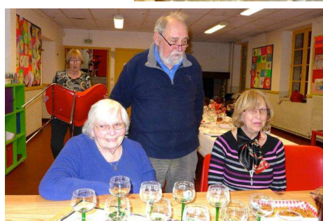
2015 - Avec les amis