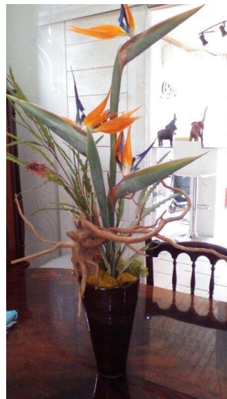
Avril/Mai 2021 – Oiseaux du paradis (strelitzia) Graminées à fleurs rouges et bois arrangés.