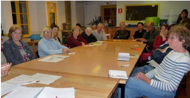
Soirée du 25 mai 2009 pour préparer la fête